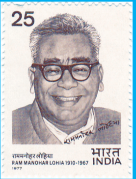
ராம் மனோகர் லோகியா