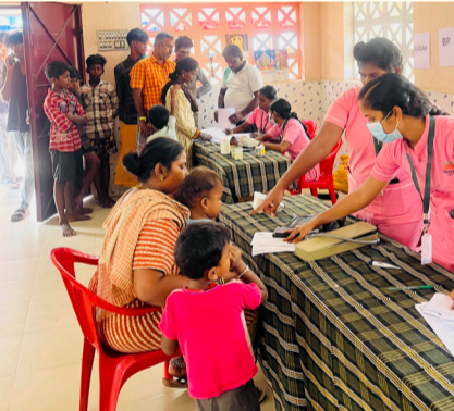
அனைத்திந்திய இளைஞர் பெருமன்றம் மதுரை புறநகர் சார்பாக இலவச மருத்துவ முகாம்

உள்ளிட்ட கோரிக்கைகளை வலியுறுத்தி வரும் 08.04.2025 செவ்வாய்க்கிழமை கோட்டையை நோக்கிப் பேரணி செல்வது என்று இக்கூட்டம் ஏகமனதாக முடிவு செய்கின்றது.