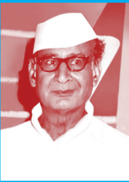
இஸட் ஏ அகமது