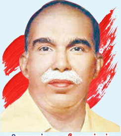
நிறுவனர்: ப. ஜீவானந்தம்